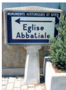
pré-enseigne « culturelle »