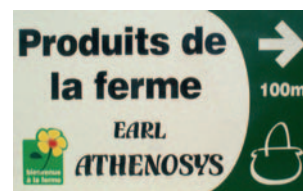
pré-enseigne « terroir »